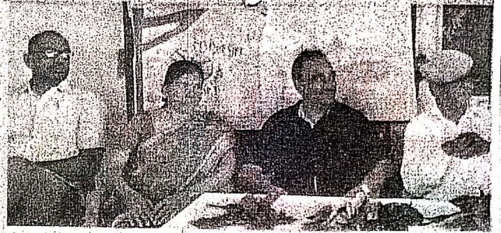
पाटन कॉलेज में आयोजित कार्यक्रम में उपस्थित अतिथि।

जैविक खेती की बात करते हुए मिट्टी के घरों को भी जल संरक्षण के लिए आवश्यक बताया। सोखता गड्ढा बनाकर और पेड़ पौधे लगाकर छोटे छोटे स्तर पर जल संरक्षण करने की बात कही।